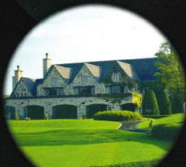
セントクreekゴルフクラブ