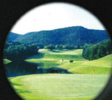
スプリングフィールド ゴルフクラブ