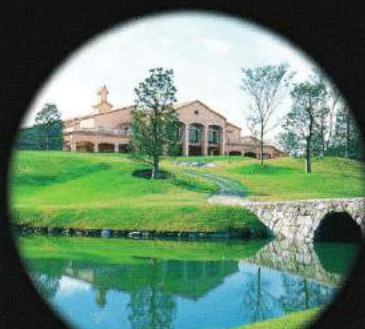
ザ・トラディションゴルフクラブ