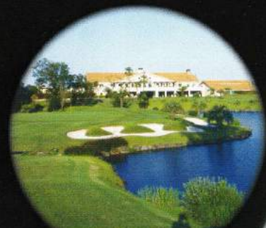
グレイスヒルズ カントリー倶楽部